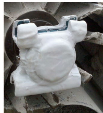
Arriba: Aplicación Enviropeel in situ